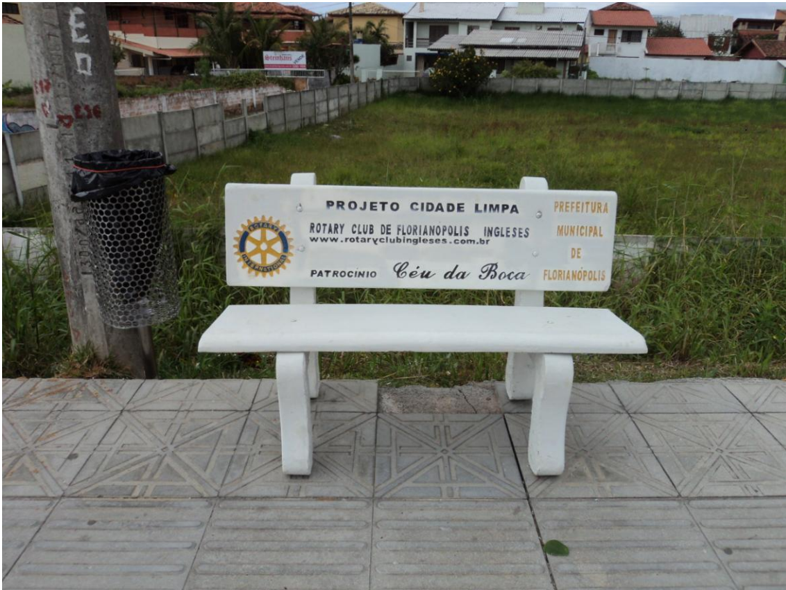
Banco de concreto com a placa conforme modelo ao lado